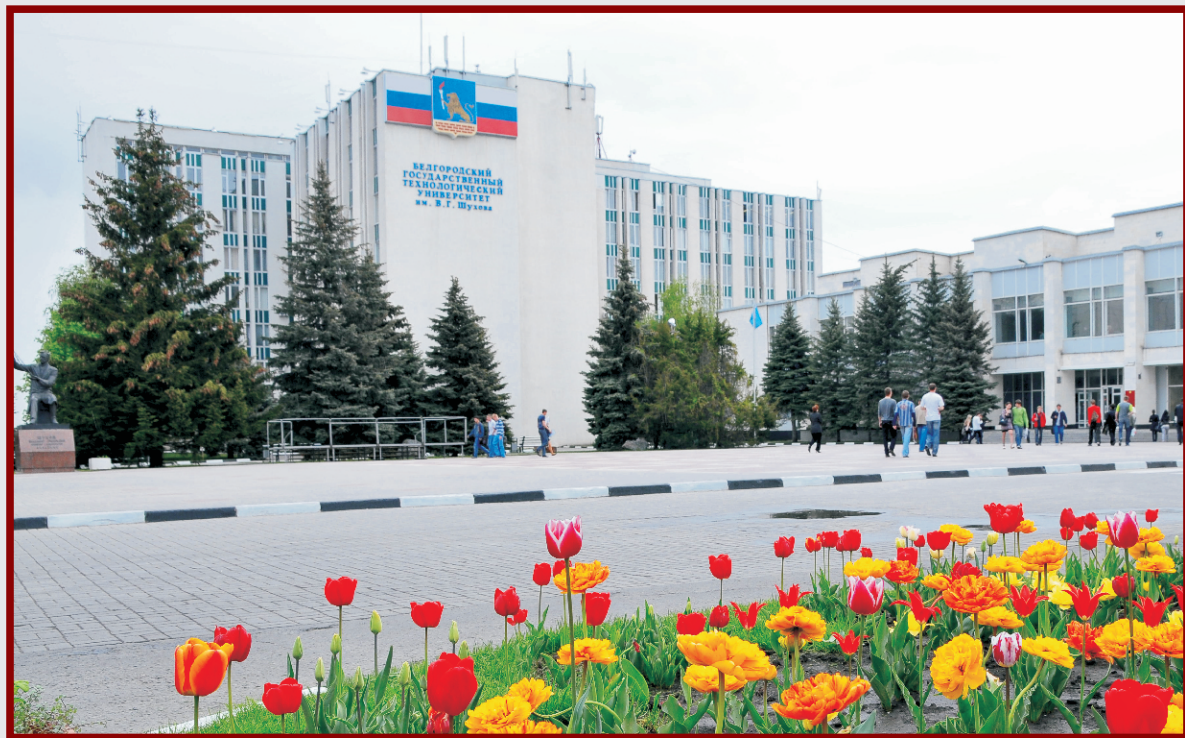
舒赫夫别尔哥罗德国立工艺大学